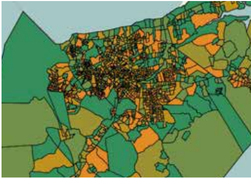
MAPAS TEMÁTICOS DE POBLACIÓN

Geobis ofrece un conjunto de alternativas adecuadas en unos pocos pasos para entender los temas asociados con la ubicación geográfica de los clientes y las relaciones de gran importancia que éstas guardan con las características demográficas y socioeconómicas.