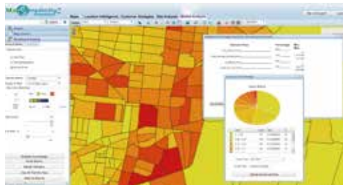
Potencial del mercado